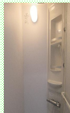
女性専用休憩所 シャワールーム完備