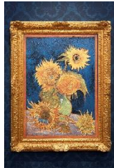
ゴッホ 幻の「ヒマワリ」